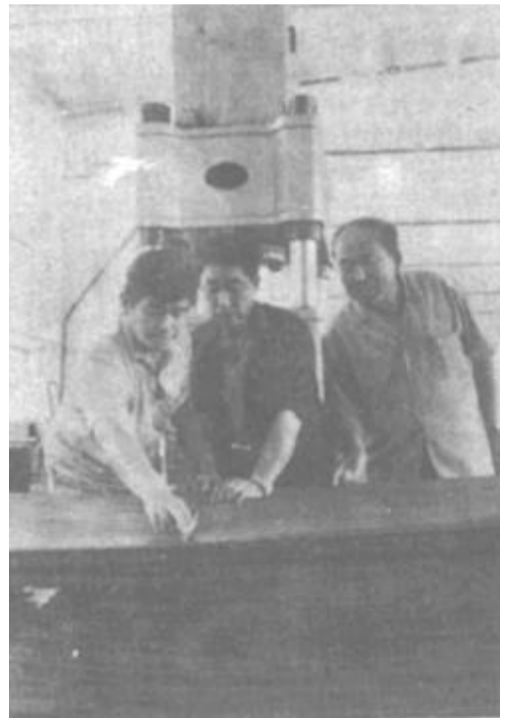
△ 市迎春机械厂狠抓产品质量，经济效益大幅度增长。上半年实现产值219.5万元，销售额207.5万元，利税45.3万元。