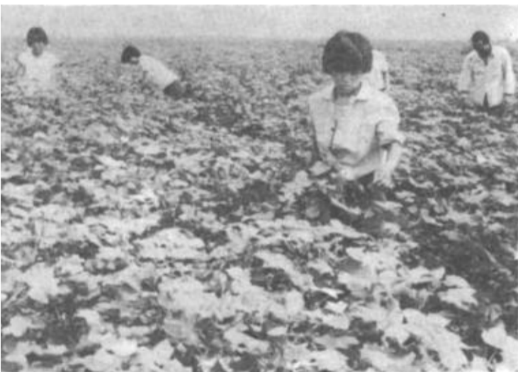
为把旱灾造成的损失降到最低点，东营区供销社紧紧抓住处暑后棉花最后半个月有效结铃期，组织指导棉农全力以赴投入棉花后期管理，力争多拿秋桃，增加棉花产量。图为龙居乡棉农们正在进行棉花整枝。