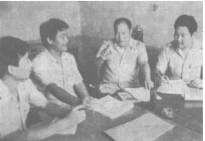
广饶县公安局刑警队适应改革开放的新形势，努力提高办案效率。1—7月份破案率达86%，六起大案都及时迅速地破获，受到上级领导表扬。图为他们正在研究全县治安形势。

这个公司拥有300多名女职工，她们常年沉在施工生产第一线，是企业建设中的一支骨干力量。为切实维护好她们的特殊利益，这个公司坚持从积极为女职工办实事入手，有针对性地做好工作。一是关心女职工的身体健康。为女职工每人建立了一份健康状况档案，同时还配备了医疗器具、设备、妇科检查人员，定期为女职工进行身体普查，发现病情，及时治疗；二是积极开办托儿所、幼儿园，想方设法为女职工解决子女上